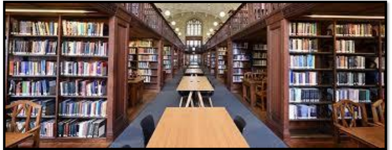
Ir a la biblioteca