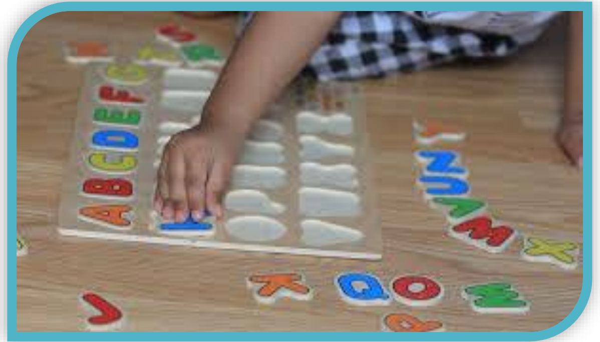
Armar un rompecabezas