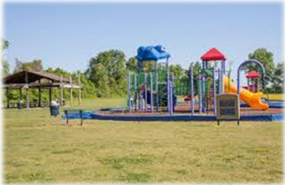
Ir al parque